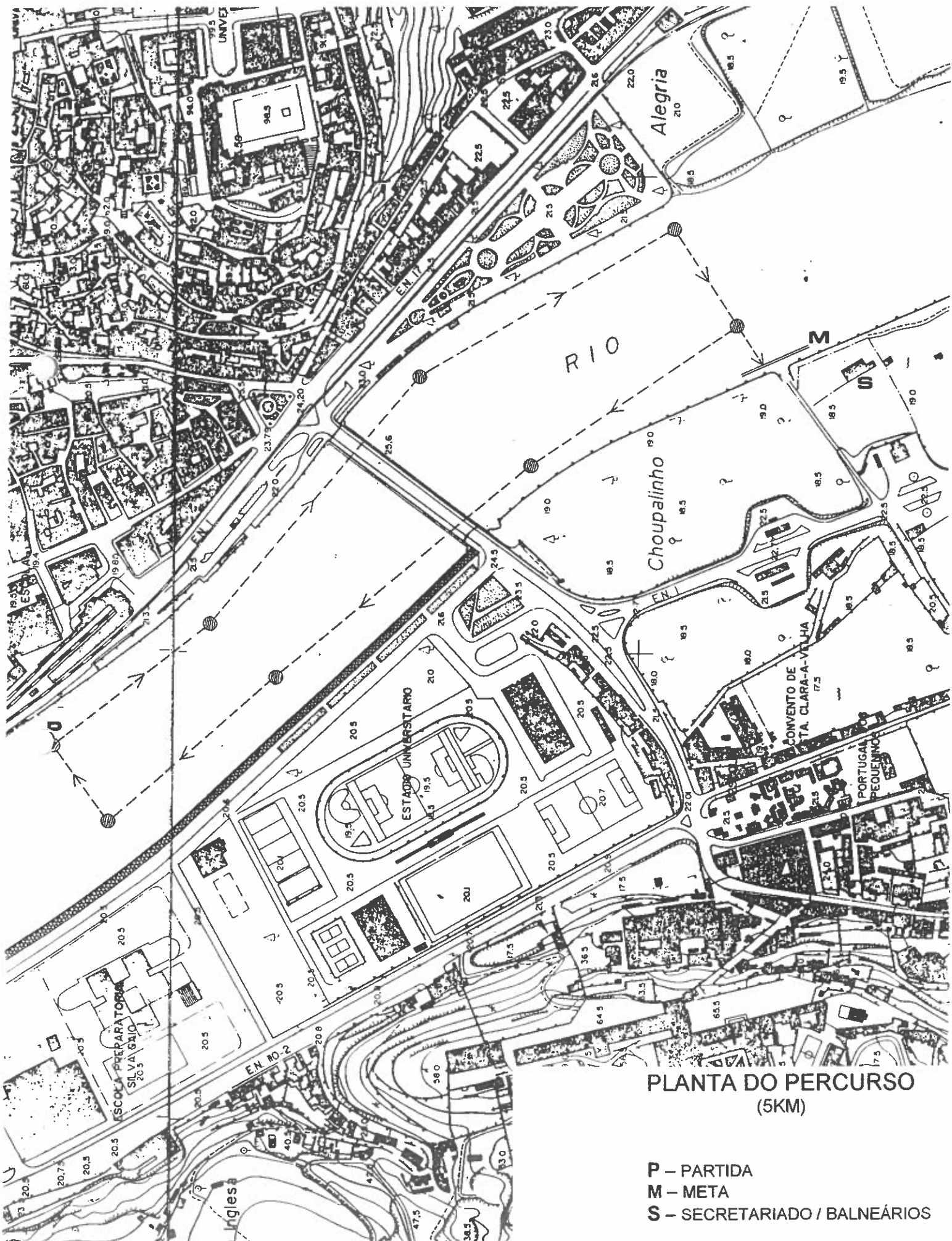
PLANTA DO PERCURSO (5KM)