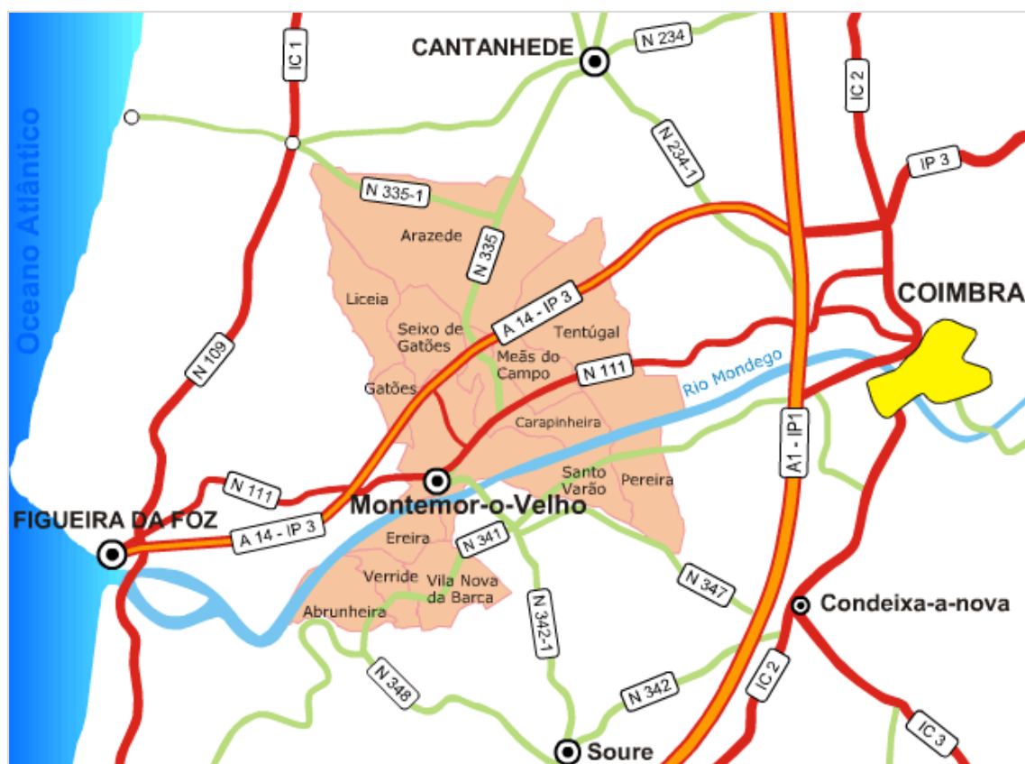
Imagem 1 – Localiza o do concelho de Montemor-o-Velho

O CNPDN situa-se no concelho de Montemor-o-Velho, localizado no centro do Pa s, pertencendo administrativamente ao distrito de Coimbra e   sub-regi o do Baixo Mondego.