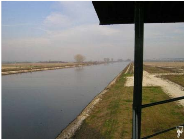
Imagem 3 – Panorama da pista

A infra-estrutura é ainda servida por um conjunto de valências que vão desde balneários masculinos e femininos até diferentes salas de apoio e gabinetes.