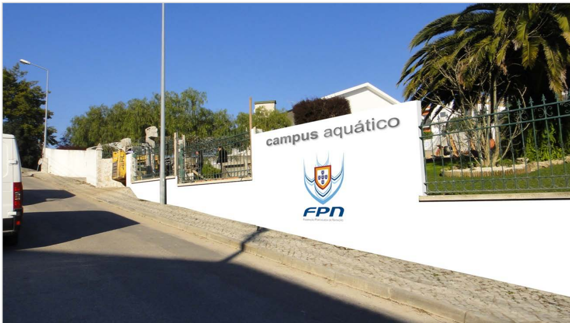
Imagem 6 – Fachada do Campus Aqu tico de MMV

O Campus Aqu tico   composto por 12 quartos, uma cozinha, uma sala de refei es, uma lavandaria, uma sala de conv vio, uma sala de reuni es, dois gabinetes t cnicos e duas salas de fisioterapia.