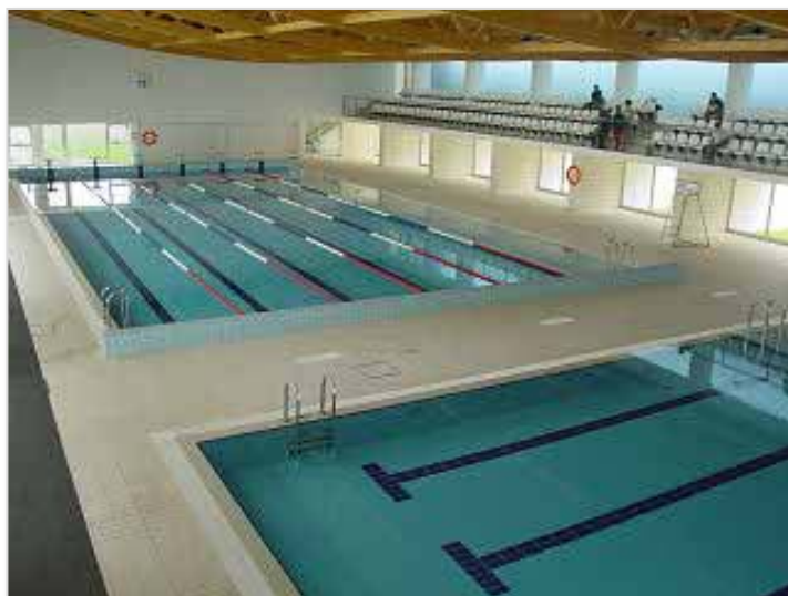
Imagem 4 – Piscina Municipal de MMV

Piscina de 25 metros, com seis pistas, que poderá ser utilizada de acordo com os horários mais adequados ao treino e que se encontra muito próximo da residência, possibilitando a deslocação a pé ou de bicicleta.