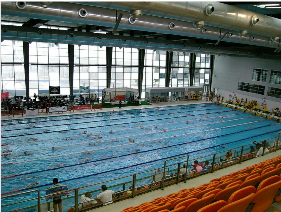
Imagem 5 – Complexo Olímpico de Piscinas - Coimbra

Estrutura que inclui uma piscina de 50 metros, com dez pistas, e uma piscina de 25 metros, com seis pistas, complementadas por um ginásio. Possibilidade de utilização por protocolo com a Câmara Municipal de Coimbra, inserida no Projecto Natação Elite do município.