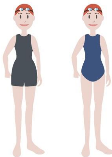
Figura 2 – Equipamentos de competi o para as nadadoras infantis.